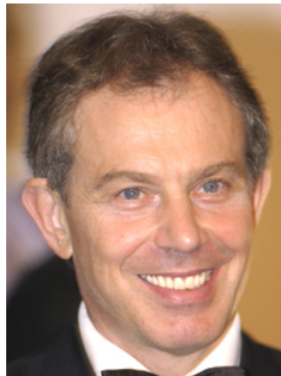
Regierungschef Tony Blair