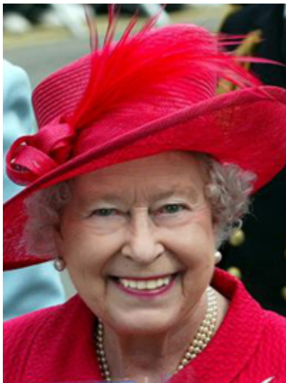
Königin Elisabeth II.