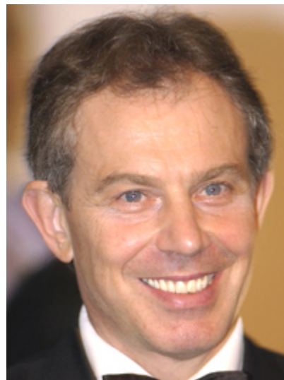
?? _____ ??