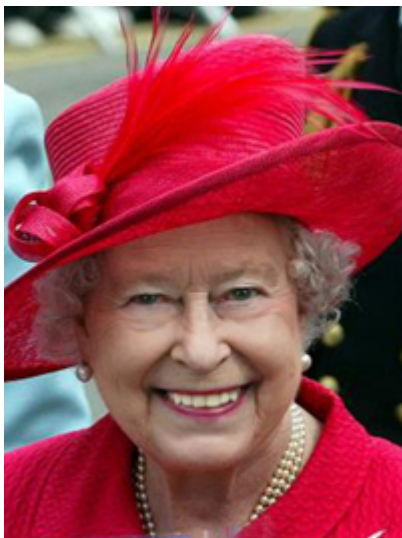
Königin Elisabeth II.