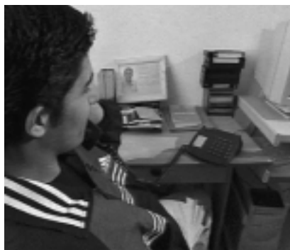
Abb. 3: Telefonieren mit den Verwandten im Irak (ZDF)

Fernsehen produzierte ein 3-minütiges »Vox Pop« (vox populi – die Stimme des Volkes), in dem Kinder und Jugendliche gezeigt wurden, die mit dem Mikrophon in der Hand ihre Meinung zum Krieg in die Kamera äußerten. SVT in Schweden hatte in seinem regulären Nachrichtenprogramm zwei Stockholmer Gymnasiasten im Alter von 12 und 13 Jahren zu Gast. Der eine Bub stammte selbst aus dem Irak und der andere hatte dort noch Verwandte. In der Sendung sprachen sie darüber, wie sie den Krieg aus ihrer Perspektive sehen und erleben und welche Ängste sie haben. Im österreichischen Confetti TiVi