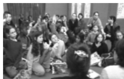
Abb. 4: ExpertInnen antworten Schulkindern (France 3)

Abgesehen von den Sendungen, die im Kinderprogramm zum Krieg ge-