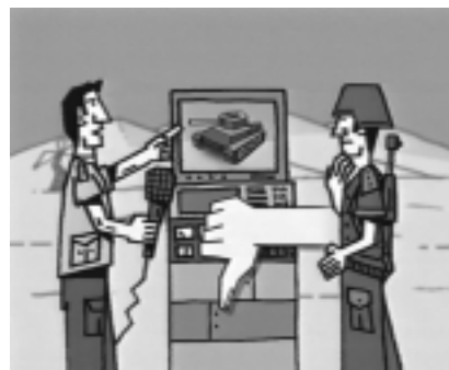
Abb. 1: Animation aus der Kindernachrichtensendung logo! (ZDF)

In der ZDF-Sendung logo! wurde Animation als Gestaltungselement herangezogen, um die Arbeitssituation der »eingebetteten Journalisten«, die mit den amerikanischen Soldaten an der Front waren, zu erläutern. Dabei wurde erklärt, dass die Journalisten ihre Berichte vom Kriegsgeschehen vom US-Militär zensurieren lassen mussten. »Und was dem Militär nicht passt«, so der logo! -Moderator, »wird auch nicht gezeigt.« Illustriert wurde dies mit einer Animation eines Journalisten, der in der Wüste mit ei-