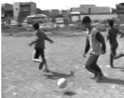
Abb. 2: Irakische Kinder beim Fußballspielen vor Kriegsausbruch

nung, dass dies – wie er vor laufender Kamera erklärt – die Familie vor Giftgasbomben schütze. Ferner hat die Familie drei Körbe mit Lebensmitteln in die Ecke des Wohnzimmers gestellt, um Vorräte für die Kriegszeit zu haben. Abschließend zeigt die Reportage, wie die zwei Brüder gemeinsam mit Freunden in der tristen Umgebung ihres Wohnortes Fußball spielen (s. Abb. 2).