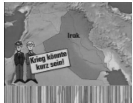
Grafisches Erklärstück der Kindernachrichtensendung logo!

Gefühl, mehr über den Krieg erfahren zu haben als nach drei Abenden CNN live.« (SZ v. 26.3.2003) – »Ein Sprachrohr für die Sorgen der Kinder.« (Thüringer Landeszeitung vom 16.1.2003) – »Gut: es gibt logo! « im KI.KA. Die Redaktion leistet Vorbildliches.« (Fernsehdienst 18/03) – »Im Bildersturm dieser Tage bewährt sich vor allem der Kinderkanal mit ausgeruhter Ausgewogenheit.« (tagesszeitung vom 1.4.2003)