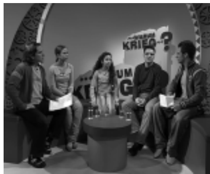
Diskussionsrunde in Kikania

ationen relativierend wirken und auch beruhigen. Nicht das Schüren von Ängsten, sondern die kindgerechte Erläuterung der Zusammenhänge ist unsere Aufgabe. Kinderfernsehen muss zur Meinungsbildung beitragen. Kinder haben völlig andere Fragen als Erwachsene. Ihre Fragen bleiben trotz zahlreicher Sondersendungen in den Programmen für Erwachsene unbeantwortet, weil niemand sie stellt. In einem Kinderprogramm aber müssen die Fragen der Kinder einen Platz finden.