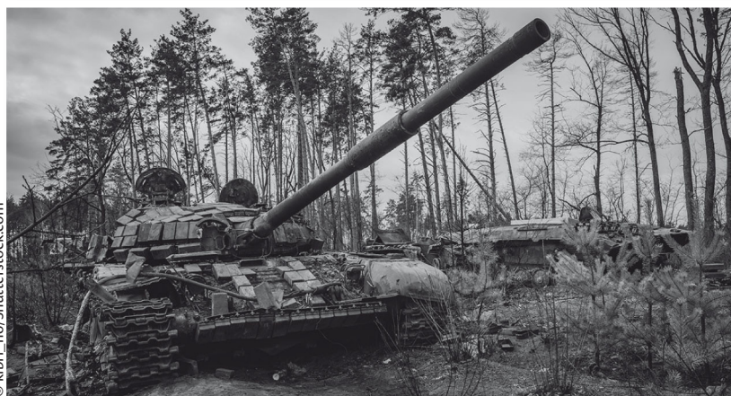
III. 3: Cuando los adolescentes describieron lo que sabían sobre el conflicto, en su mayoría hablaban de enfrentamientos, en particular de bombas y tanques.