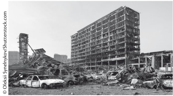
Ill. 4: Las imágenes que aumentaron las preocupaciones de los adolescentes fueron aquellas que mostraron la guerra y lo que deja a su paso: ciudades destruidas

mentaron los miedos de los adolescentes fueron aquellas que mostraron la guerra en forma de bombas, explosiones de bombas y tanques. (Ill. 3) así como también el daño a edificios causado por la guerra: ciudades destruidas y casas arruinadas (Ill. 4). En muchas descripciones del miedo disparado por medio de las imágenes, la imagen de edificios residenciales destruidos por bombardeos se combinaba con cuerpos sin vida o personas heridas, así como con personas escondiéndose y huyendo.