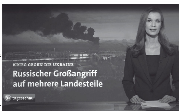
Ill. 1: 45% de los 181 adolescentes participantes (13-17) usan la televisión como fuente de información (aquí: el programa alemán de noticias de horario central tagesschau, ARD)

23 y 24 de febrero de 2022 muestra que todos los adolescentes encuestados habían oído hablar del conflicto y más del 90% pudo mencionar las partes involucradas y la dirección de la agresión. Aquí, la comprensión de los adolescentes sobre la situación variaron desde una mención superficial de la situación hasta imágenes más complejas, números de vehículos militares, vínculos económicos entre Alemania y Rusia, y el papel de la OTAN.