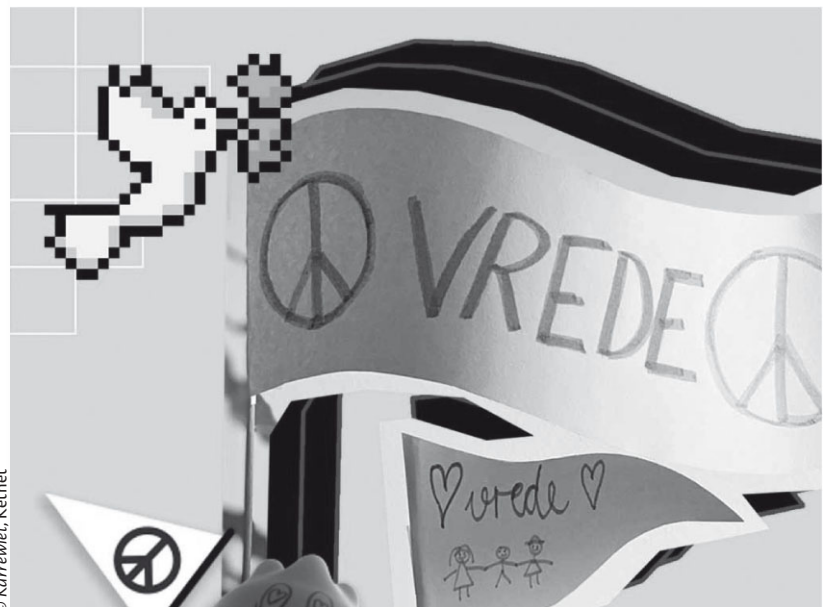
III. 1: Ketnet inició la campaña „Banderas por la Paz“ en la cual los niños y niñas colocaron sus banderas diseñadas por ellos mismos como mensaje de paz en ventanas, balcones, etc.

sobre todo, llenos de esperanza. Es difícil decir cuántas banderas se hicieron, pero cuando caminabas por las calles de Bruselas o Flandes, las podías ver en todas partes. El mensaje era simple y claro, y cuando un refugiado ucraniano entraba a la calle, se sentía bienvenido. En ese momento, hicimos mucho para hablar sobre el tema con los niños de Bruselas y Flandes. Sin embargo, también queríamos hacer algo por los niños ucranianos que ahora vivían en un país extranjero. Por eso decidimos subtítular nuestras noticias de Karrewiet al ucraniano. Sabemos que en muchas escuelas los niños y niñas comienzan su día viendo Karrewiet junto con sus compañeros y compañeras de clase. Nos aseguramos de que hubiera una versión subtitulada disponible en nuestro sitio web y aplicación todos los