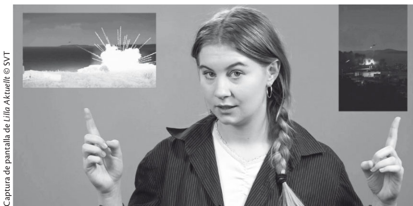
Captura de pantalla de Lilla Aktuell

difíciles o problemáticos. Antes del 24 de febrero de 2022, nuestro equipo editorial prestaba mucha atención a la situación en Ucrania. Cuando comenzaron los ataques rusos, de inmediato nos dimos cuenta de que se