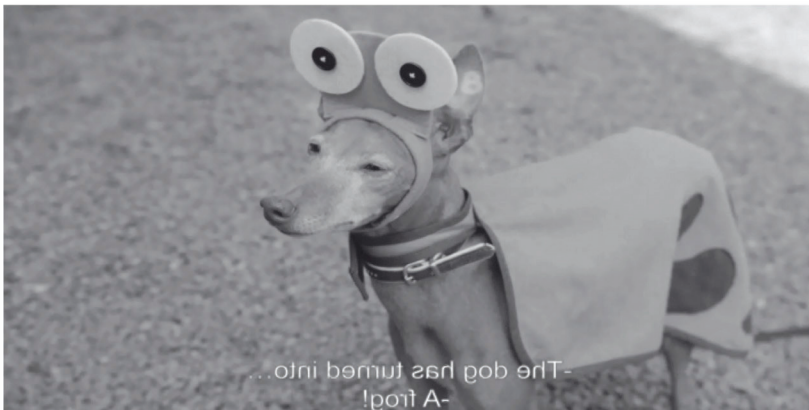
III. 2: El Oso Bo transforma al perro en una rana para que sea menos aterrador para Ruby

rana. El perro-rana comienza a croar, como una rana, lo que lo hace menos temible (III. 2). Entonces Ruby puede pasar delante del perro y agarrar su canica. Esta historia es muy importante para los niños de esa edad.