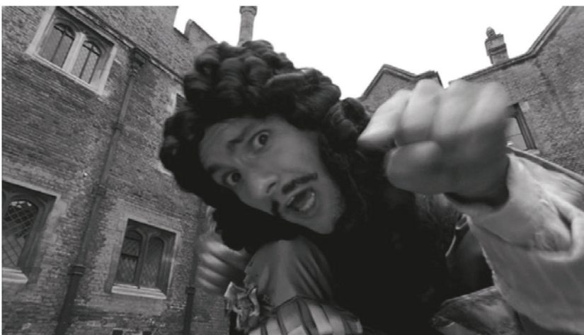
III. 2: Creativo y atractivo para los jóvenes: Carlos II interpreta un rap “King of Bling” (Rey de la ostentación) y afirma que él rescató la diversión luego de un período puritano.