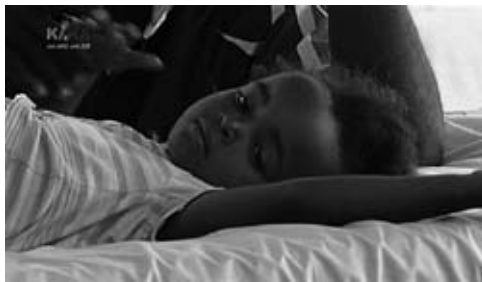
Abb. 2: Manipulation 2: Kindernachrichtenwert hoch: »Viele Kinder und Jugendliche in einem Ort in Simbabwe haben sich mit der Krankheit Cholera angesteckt. Nun suchen sie die Hilfe von Ärzten.«

Bei den 5 ausgewählten Beiträgen handelte es sich um folgende Themen: eine Bio-Verordnung in der Hühnerhaltung, der Ausbruch der Krankheit Cholera in Simbabwe, ein gerissenes Unterseekabel im Indischen Ozean, ein belgischer Junge,