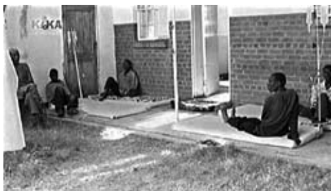
Abb. 3: Manipulation 1: Klassischer Nachrichtenwert hoch: »Fast alle Bürger von Simbabwe haben sich mit der Krankheit Cholera angesteckt. Sie breitet sich plötzlich und ganz unerwartet in ganz Afrika aus und betrifft vor allem Erwachsene.«

der Modedesigner werden möchte, sowie die Bestrafung lautstarker Jugendlicher mit Musik in einem US-Bundesstaat.