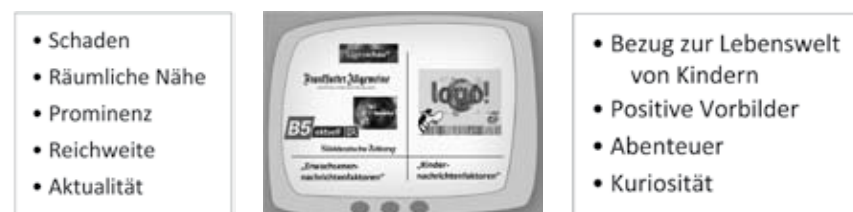
Abb. 1: Klassische Nachrichtenfaktoren (li.) und Kindernachrichtenfaktoren (re.)

Neben inhaltlichen Kriterien wird eine Nachrichtensendung auch von gestalterischen Aspekten bestimmt. Dabei hat sich gezeigt, dass Merkmale wie z. B. die Sprechgeschwindigkeit oder das Tempo der Schnittwechsel und das Vorhandensein von Text-Bild-Scheren einen Einfluss auf die Behaltensleistung der ZuschauerInnen haben (Brosius 1995). Die Frage, ob auch diese Gestaltungsfaktoren Einfluss auf die Selektion von Nachrichteninhalten haben, wurde bisher jedoch noch nicht empirisch untersucht.