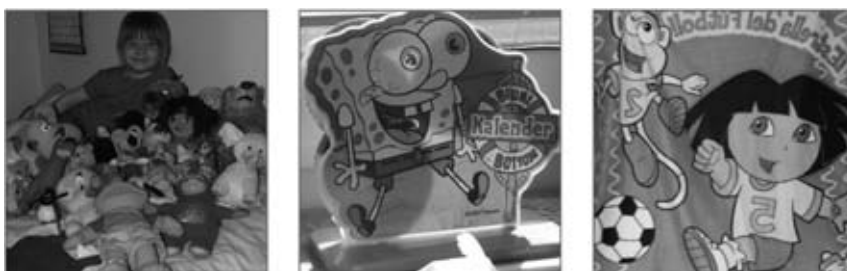
Die Lizenzprodukte einer »Media Maus«: z. B. Plüschtiere, Kalender und Bettwäsche