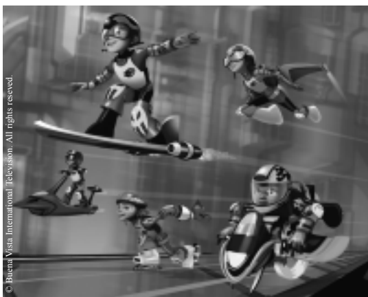
Get Ed : Ed (auf dem Board) und seine Freunde auf dem Weg durch Progress City

Wie kommt dies und was bedeutet dies für die Anforderungen, die Jungen an Programme stellen, die sie interessieren und von denen sie sich auch angesprochen fühlen?