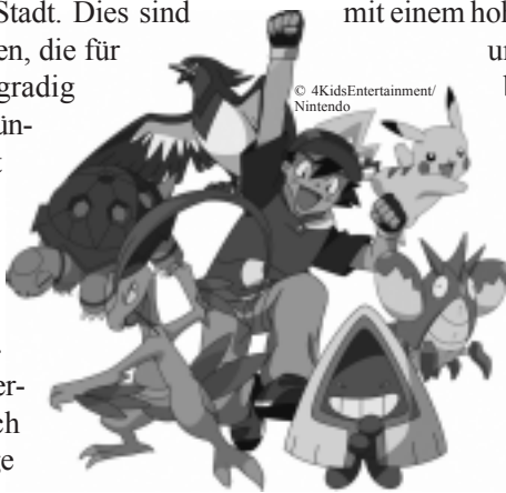
Pokémon: Ash (Mitte) mit Pokémons

Hinzu kommt, dass die Serie facettenreiche Einzelfiguren, aber auch ein interessantes Figurenensemble anbietet. Die Figuren müssen untereinander zusammenhalten und ergänzen sich in ihren Fähigkeiten. Neben Glaubwürdigkeit der einzelnen Figuren zählt vor allem, dass sie besondere Fähigkeiten besitzen oder auch im Aussehen Akzente setzen. Jeder von Eds Freunden hat ganz besondere Talente, so ist Burn – der Unerschrockene – ein Ass auf seinem Motor-BMX oder Loggie – ein wahrer Komiker – der schnellste Inline-Skater der Stadt. Dies sind alles Fähigkeiten, die für Jungen hochgradig attraktiv und wünschenswert sind. Gleichzeitig wird durch das Setzen von besonderen Akzenten und Übertreibungen auch immer die nötige Distanz angeboten. So zu sein