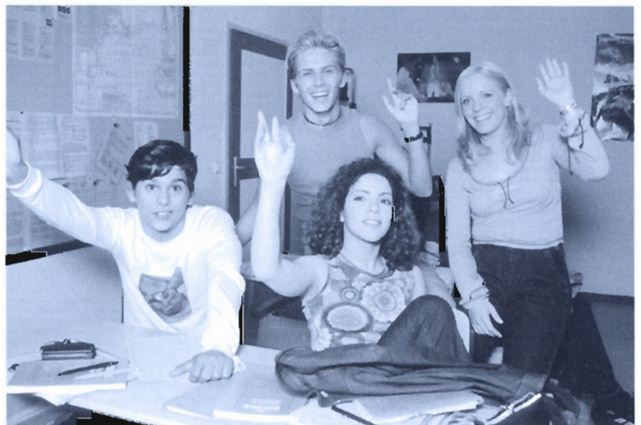
Die Schul-Clique: Dino, Marlon, Lucy, Toni

Frederik Neuhaus ist glasknochenkrank und sitzt im Rollstuhl. Wir haben diese Figur nicht als hilflosen, barmherzigen Menschen eingeführt, sondern als jemanden mit großem Selbstbewusstsein, der darauf Wert legt, nicht als Opfer gesehen zu werden. Ein Mensch, der im Rollstuhl sitzt und nun einem Mädchen eine Liebesbeziehung beginnt. Hannah ist HIV-positiv. Wie lebt es sich mit dieser Krankheit? Wie kann man normal mit HIV-Kranken umgehen? Wie kann ein HIV-positiver Mensch eine Liebesbeziehung führen? Alles Dinge, die wir erzählt haben.